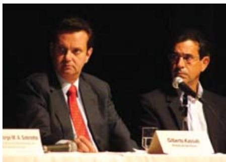
Prefeito Gilberto Kassab participa do lançamento do Programa Madeira é Legal

O programa tem como objetivo incentivar e promover o uso da madeira de origem legal e certificada na construção civil no Estado e no Município de São Paulo por meio da cooperação técnica e institucional entre as partes para viabilizar, de forma objetiva e transparente, a adoção de um conjunto de ações que garantam a consolidação do Programa, buscando desenvolver mecanismos de controle como a exigência da apresentação do Documento de Origem Florestal (DOF) e incentivo ao uso da madeira certificada nos departamentos de compras dos setores público e privado – como as grandes construtoras –, para identificar e monitorar a madeira que está sendo comprada – que deve ser de origem legal ou certificada. Segundo Mauro Armelin, da WWF-Brasil, “com metas sabemos onde temos que chegar; e se não são cumpridas