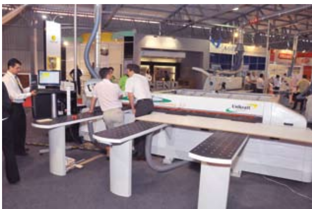
Visitantes conhecem novos equipamentos