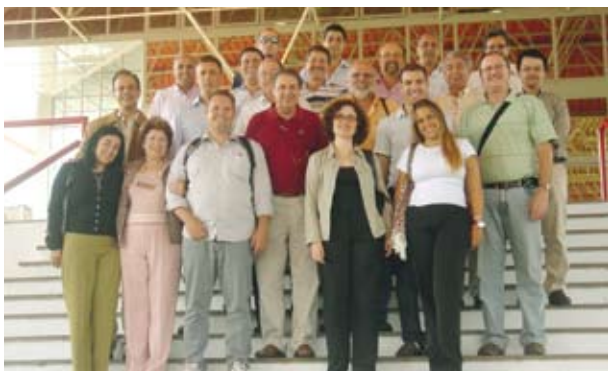
Comitiva Missão FIMMA 2009

Também com o apoio da Apex, três jornalistas especializados (do Chile, Estados Unidos e México) visitaram a Feira com o intuito de divulgar o evento.